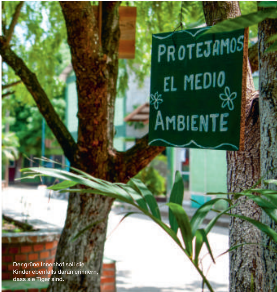
Der grüne Innenhof soll die Kinder ebenfalls daran erinnern, dass sie Tiger sind.